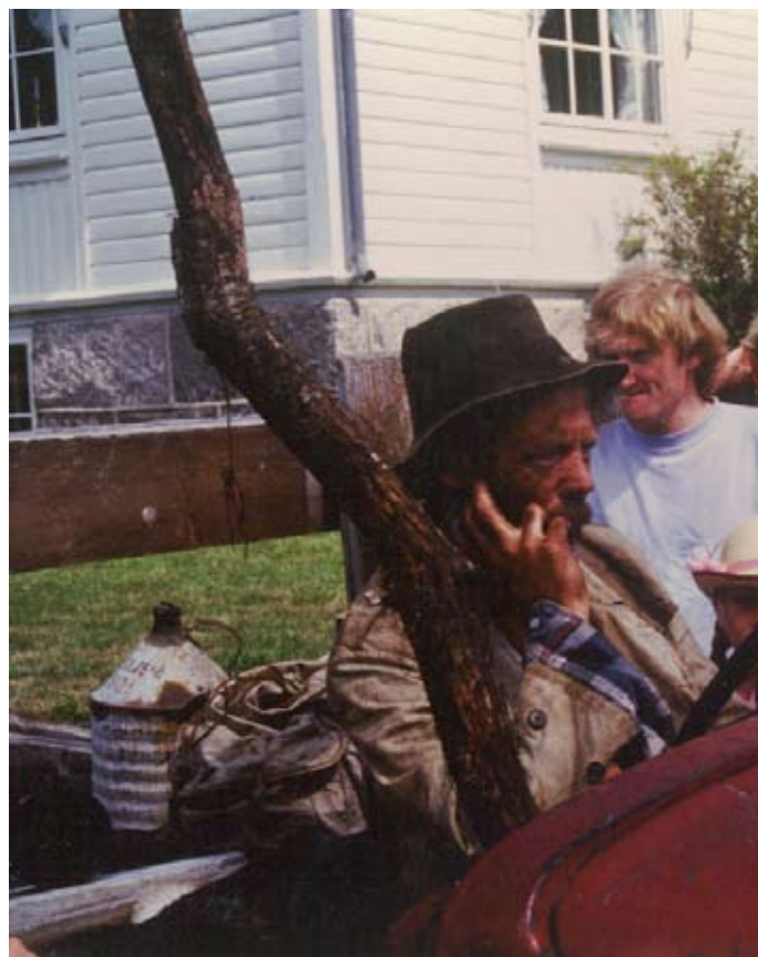
Mimrebilder fra Trekkferjefestivalen, antakelig fra tidlig på 90-tallet.